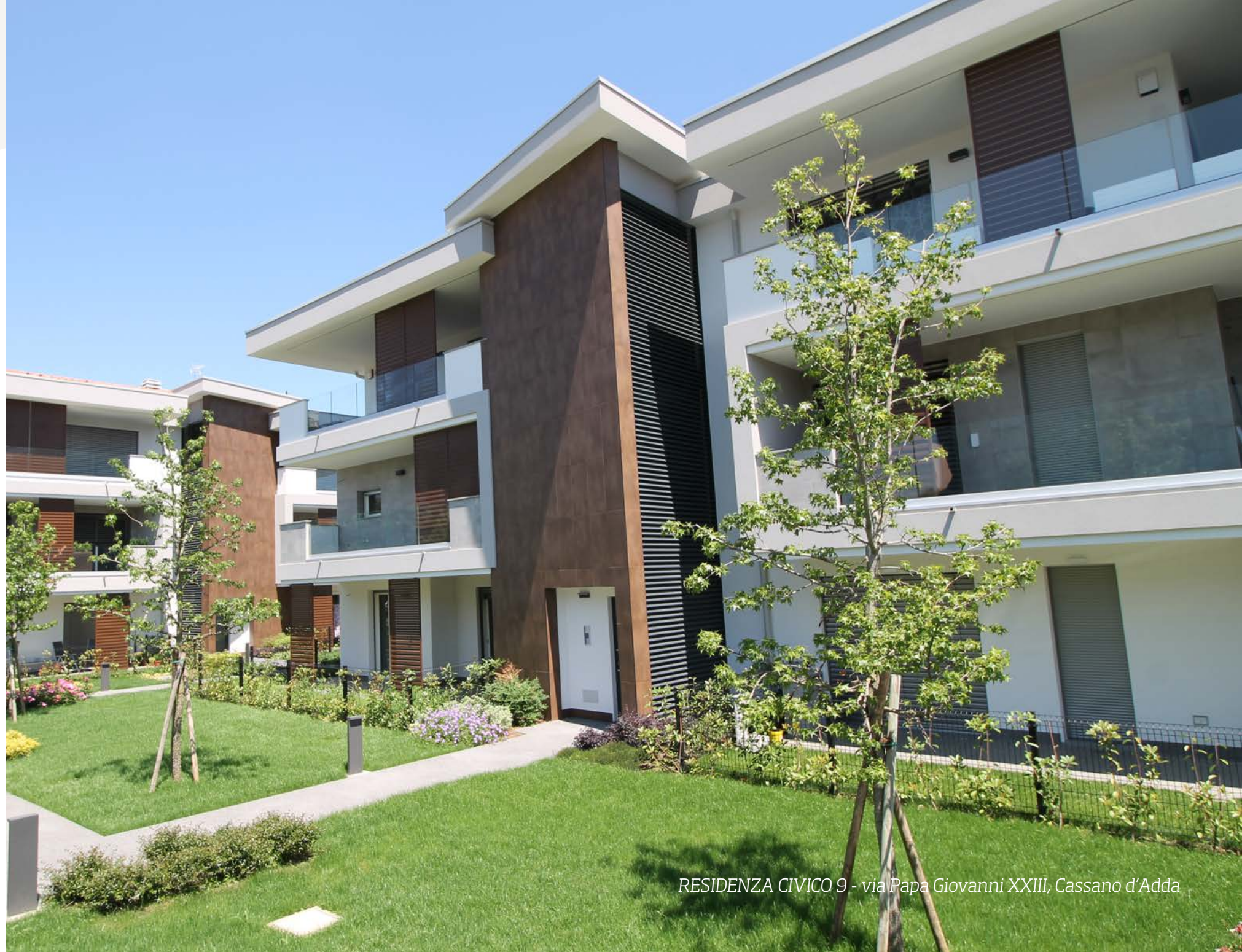
RESIDENZA CIVICO 9 - via Papa Giovanni XXIII, Cassano d'Adda