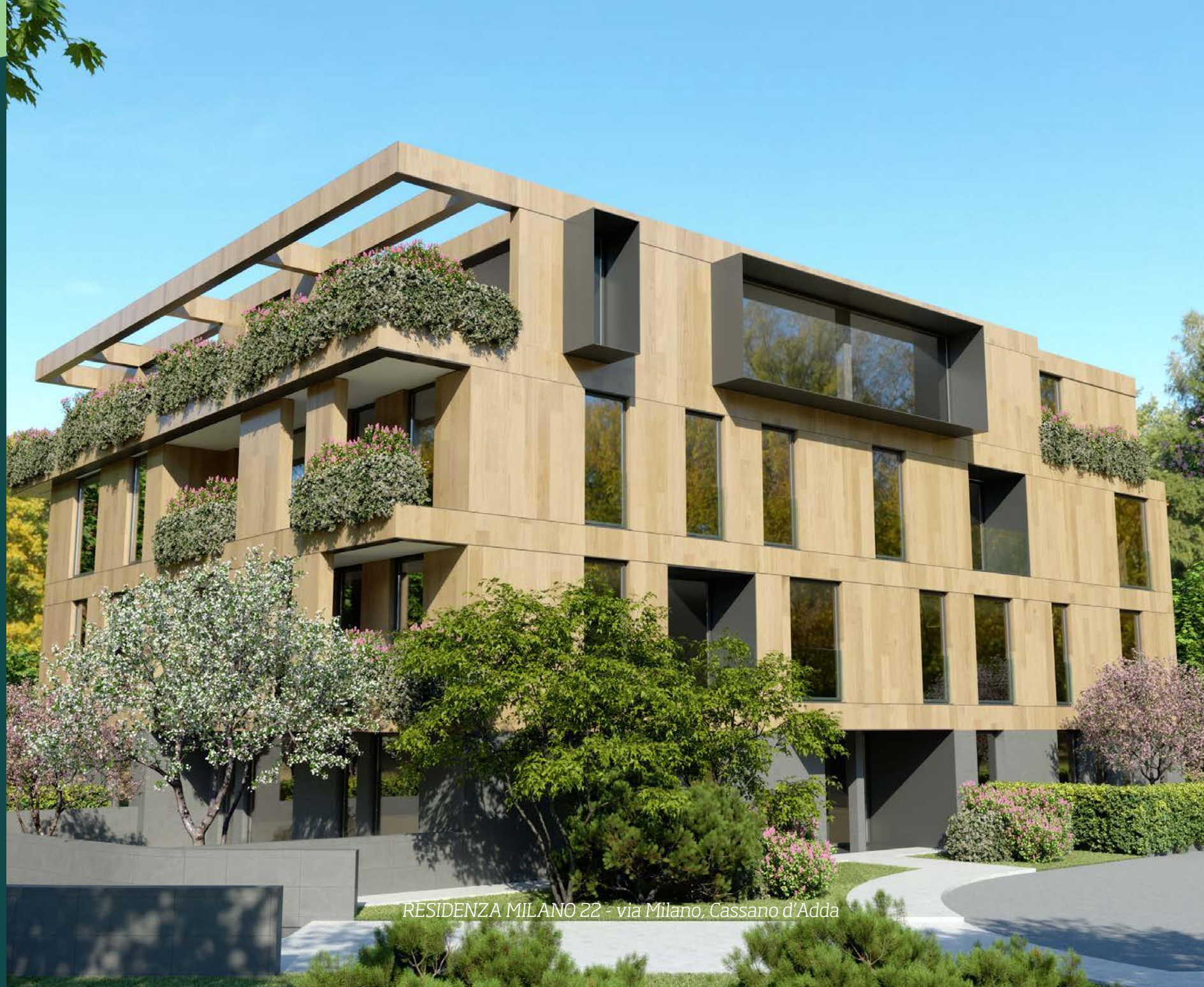
RESIDENZA MILANO 22 - via Milano, Cassano d'Adda