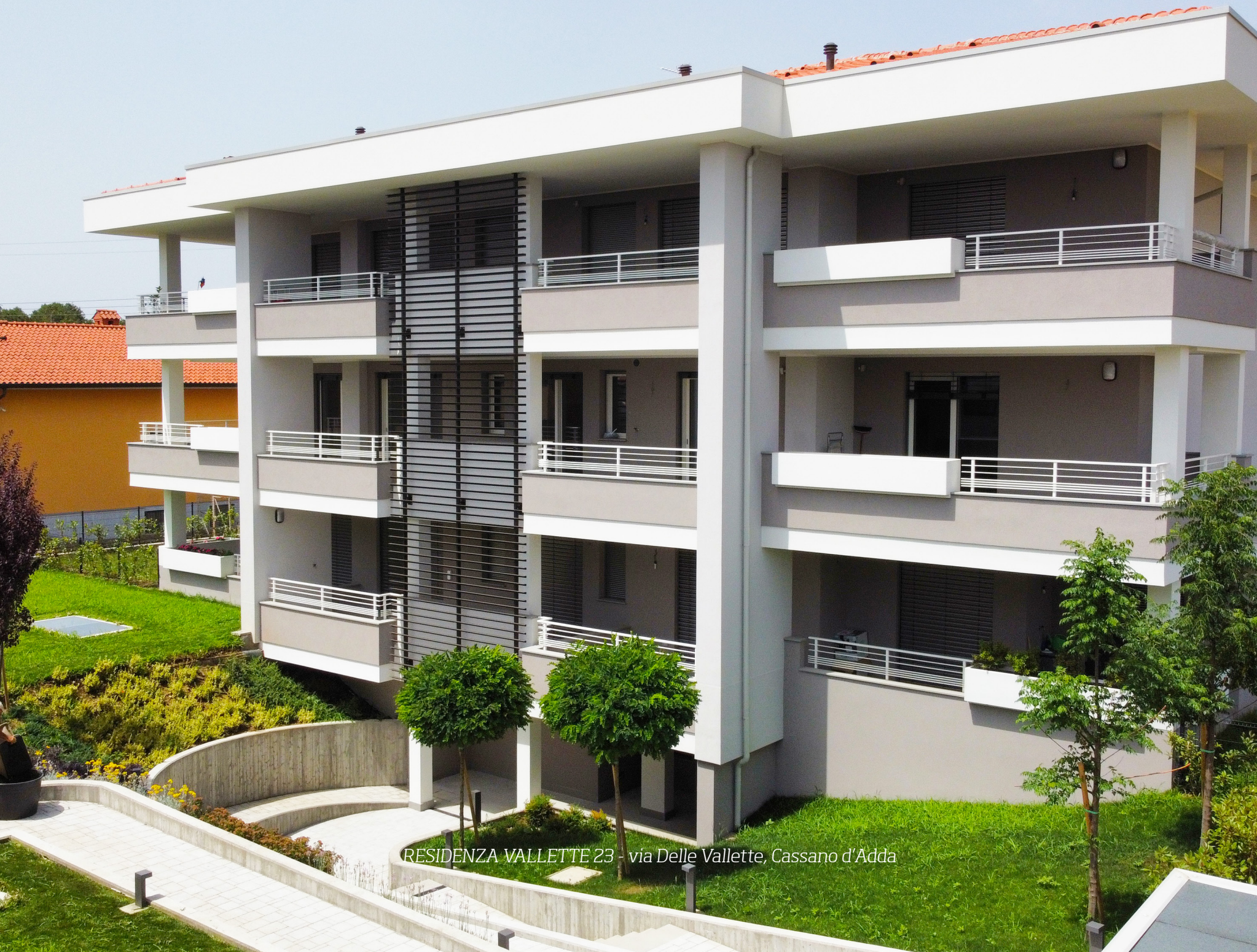
RESIDENZA VALLETTE 23 - via Delle Vallette, Cassano d'Adda