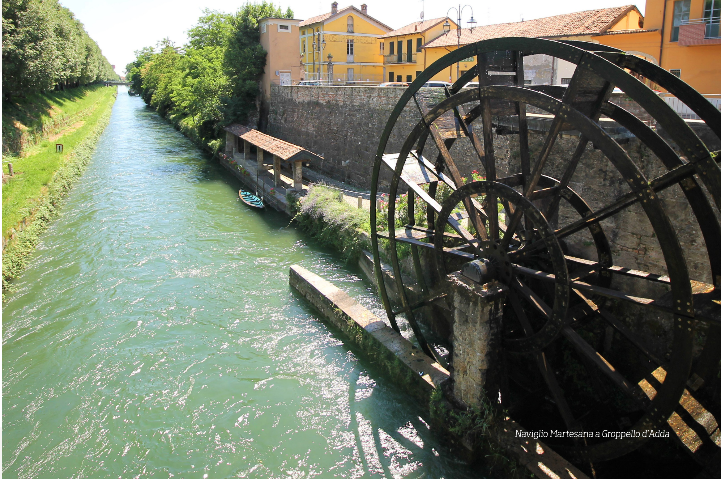
Naviglio Martesana a Gropello d'Adda

La pista ciclabile attraversa tutta la città e permette di arrivare fino al centro di Milano e di Lecco.