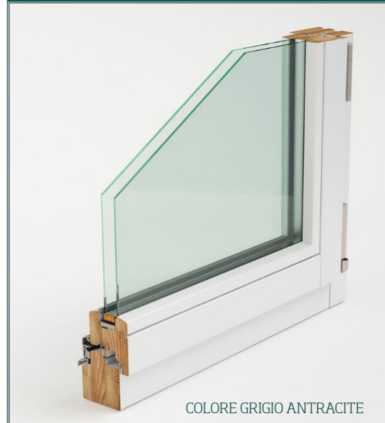
COLORE GRIGIO ANTRACITE