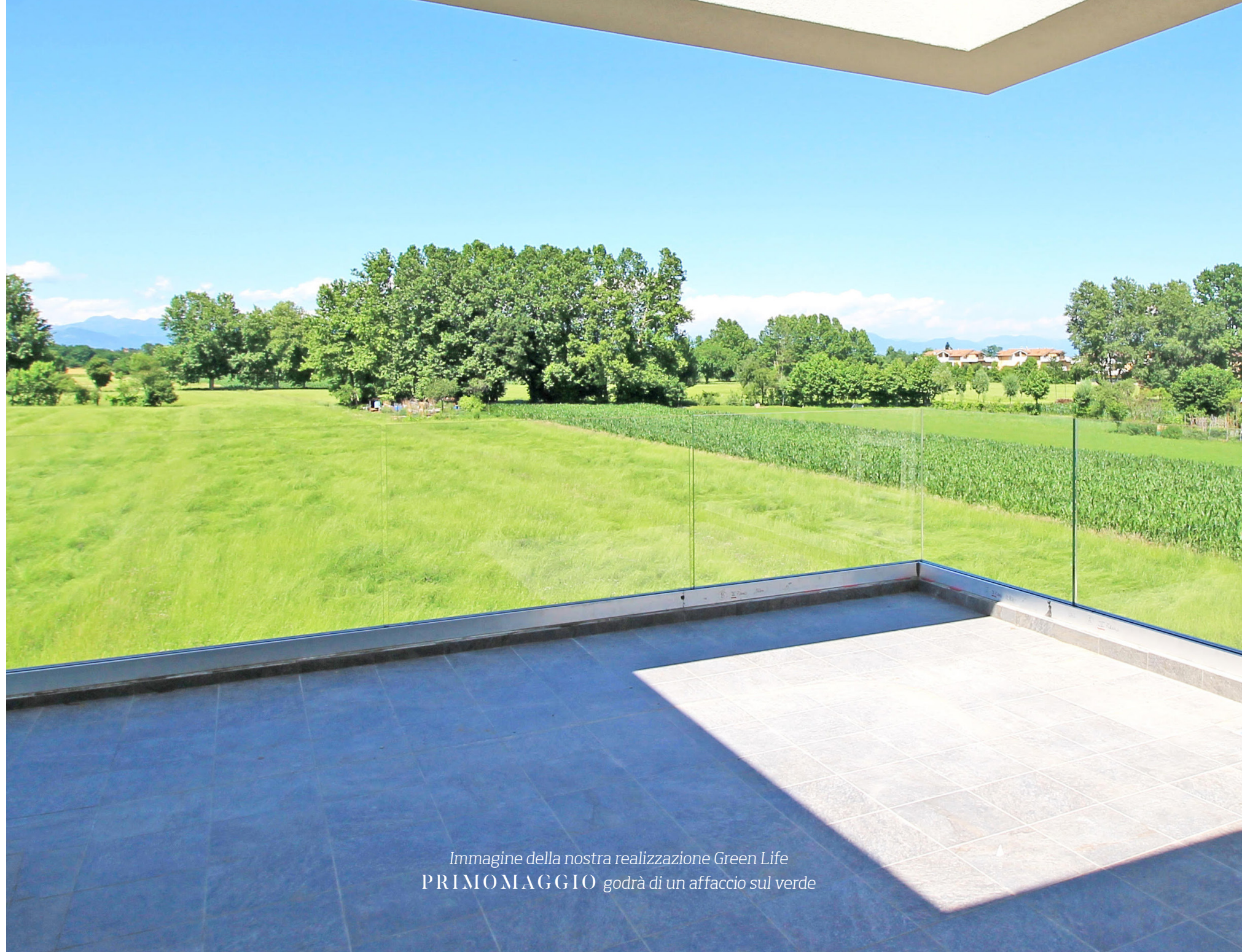
Immagine della nostra realizzazione Green Life PRIMOMAGGIO godrà di un affaccio sul verde

La tua nuova Casa nasce in un quartiere verde e arioso, dove il ritmo frenetico della città rallenta per fare posto a una dimensione più a misura d'uomo.