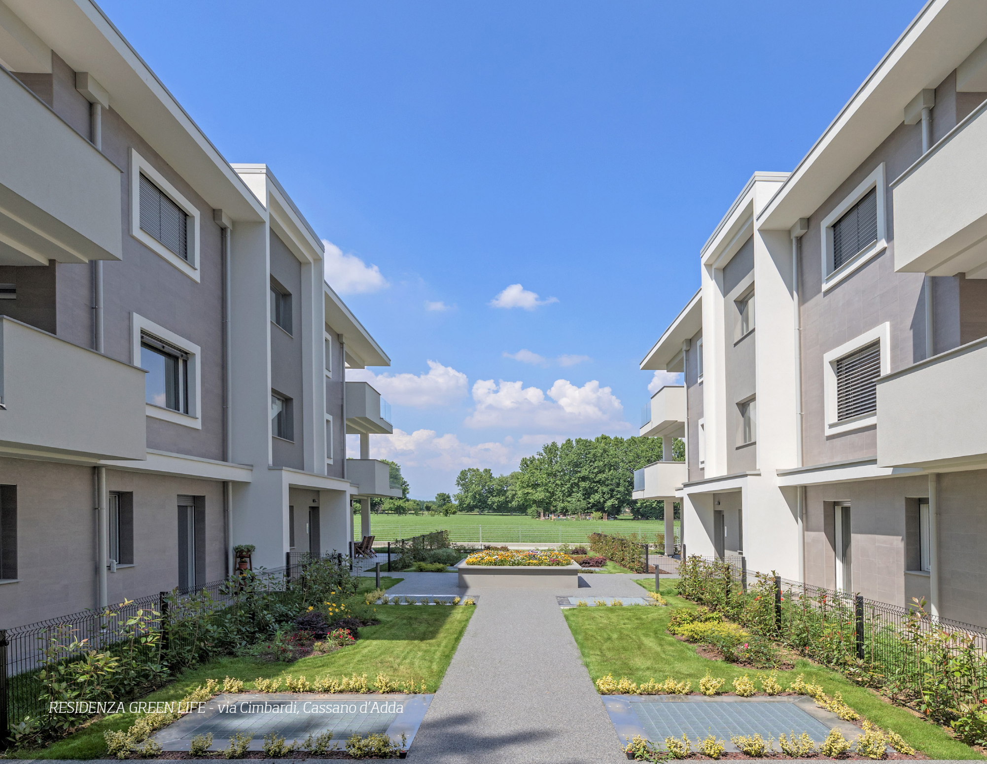
RESIDENZA GREEN LIFE - via Cimbaridi, Cassano d'Adda