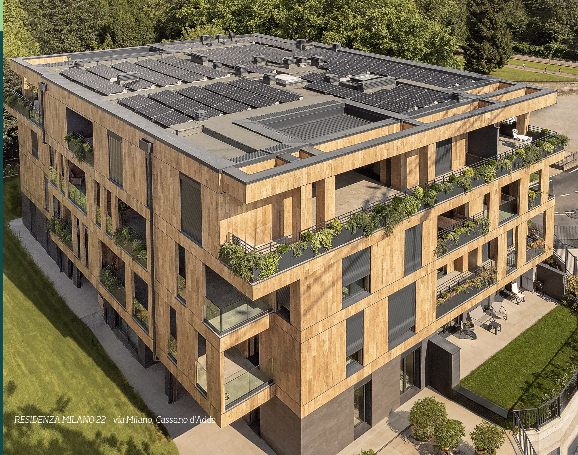
RESIDENZA MILANO 22 - via Milano, Cassano d'Adda