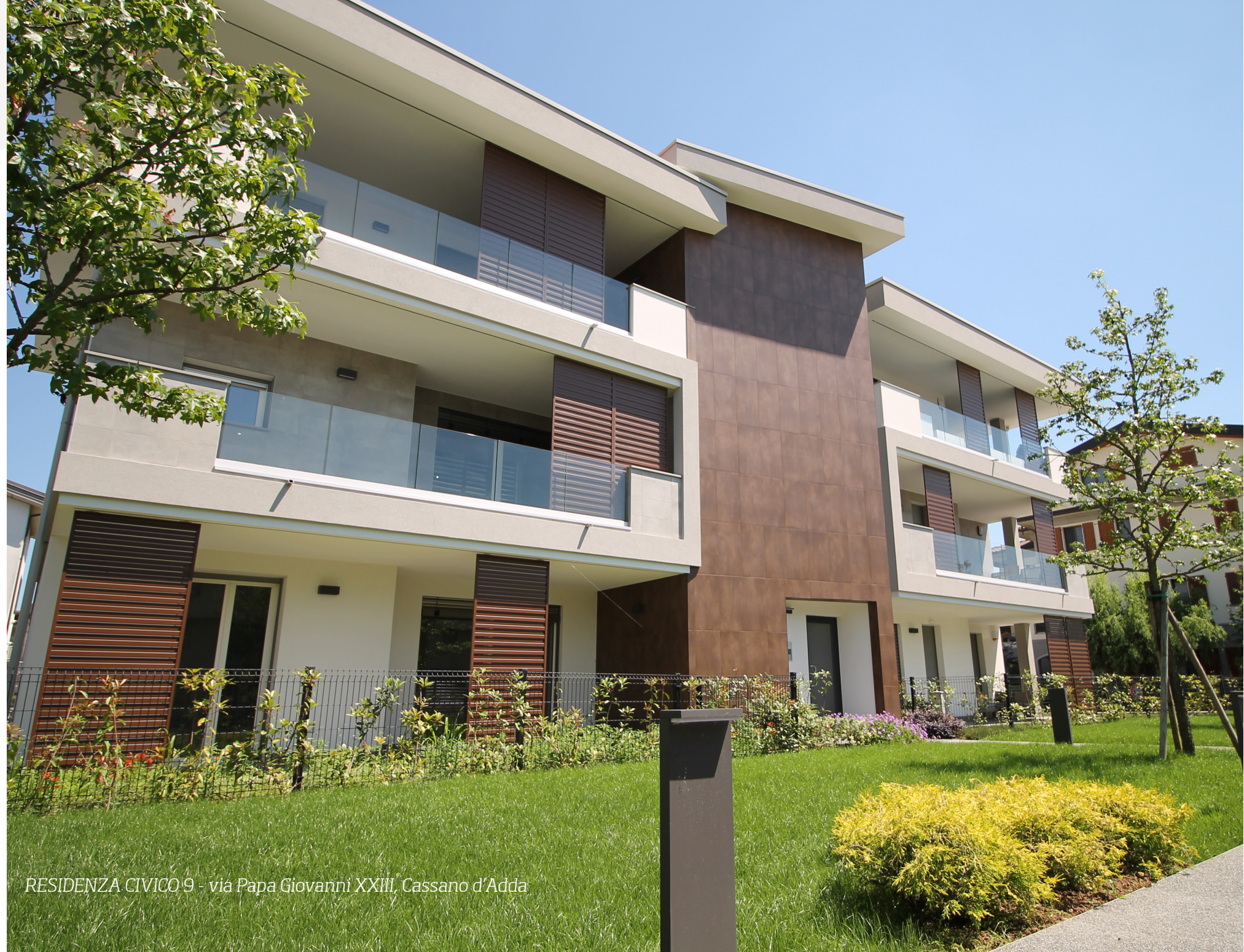
RESIDENZA CIVICO 9 - via Papa Giovanni XXIII, Cassano d'Adda

PRIMOMAGGIO nasce dal progetto dello Studio d'Architettura Claudio Brambilla & Corrado Villa.