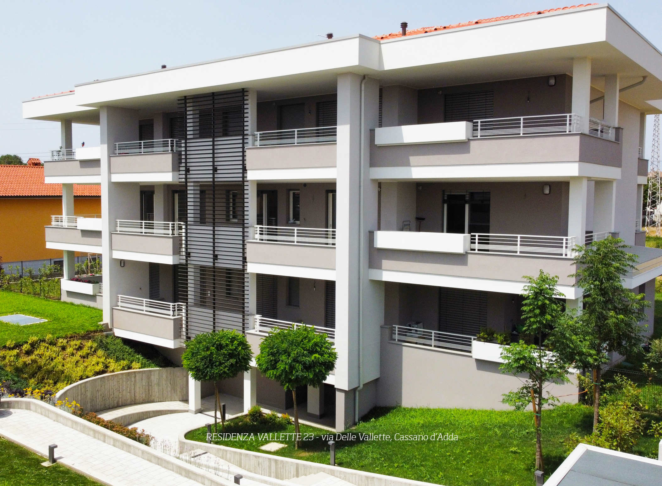
RESIDENZA VALLETTE 23 - via Delle Vallette, Cassano d'Adda